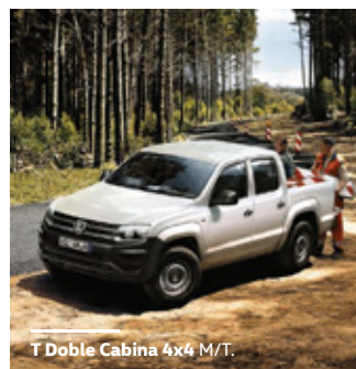
T Doble Cabina 4x4 M/T.