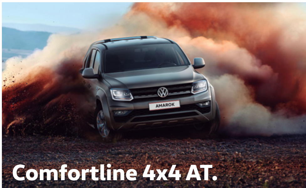
Comfortline 4x4 AT.