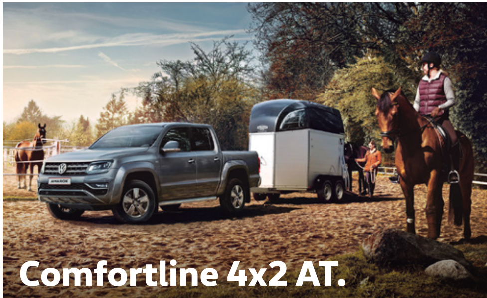
Comfortline 4x2 AT.