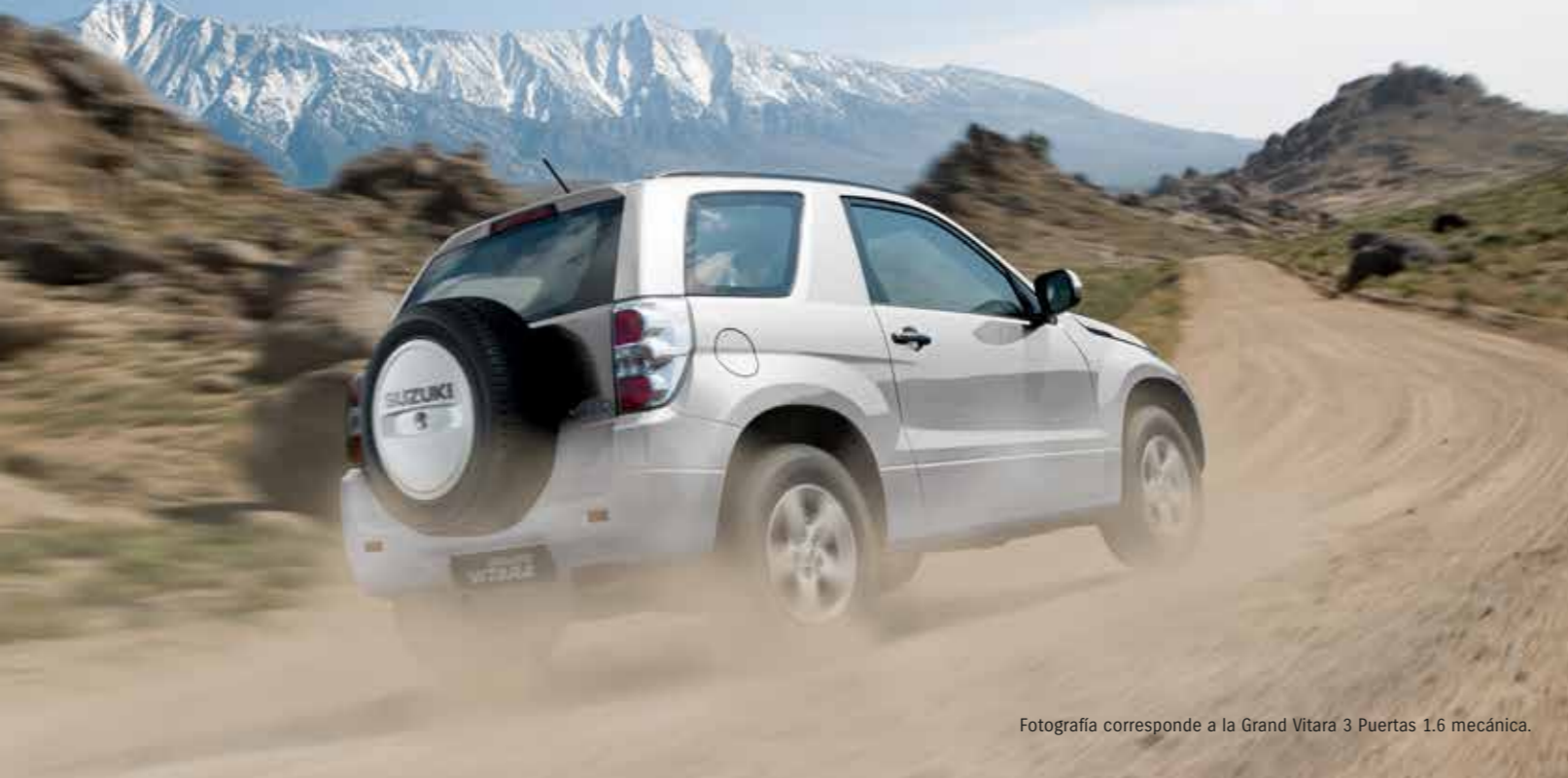
Fotografía corresponde a la Grand Vitara 3 Puertas 1.6 mecánica.